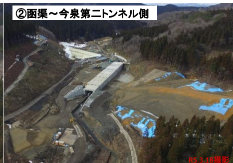
②函渠～今泉第二トンネル側