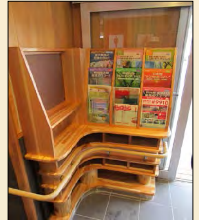
プロデュース & デザイン: はしごと 樹皮ボード提供: (株)フォレスト白神コーポレーション