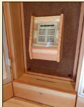
デザイン: 萩原製作所 アロマオイルプロデュース: パレアンヌ