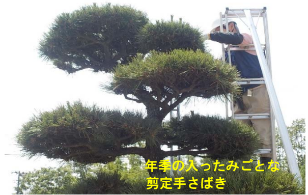
年季のいったみごとな 剪定手さばき

実施箇所は、国道7号 豊祥岱交差点から能代港 入口交差点までの区間。 黒松街道には約150本の 黒松が並んでいます。