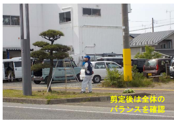
剪定後は全体の バランスを確認