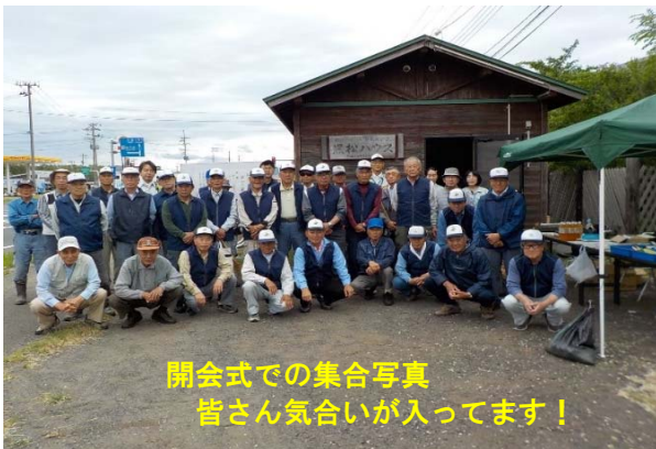
開会式での集合写真 皆さん気合いが入ってます!