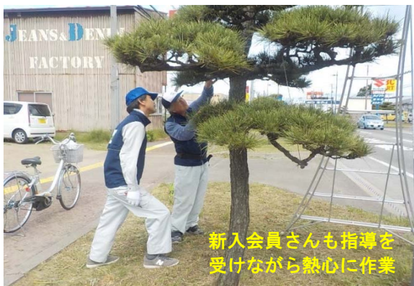
新入会員さんも指導を 受けながら熱心に作業