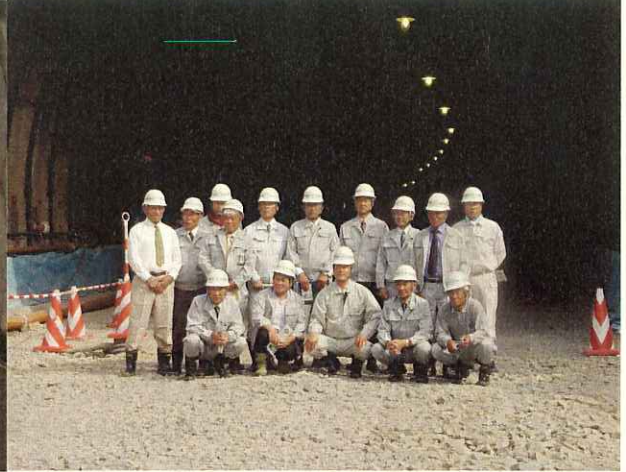
トンネル起点側坑口にて