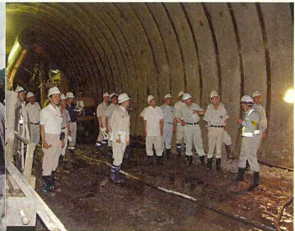
熱心に聞く水利事業所の方々

*工事現場の案内も受け付けております。希望する方はお気軽に下記まで電話でお申し込み下さい。(出来るだけまとまった人数でお願いします。)