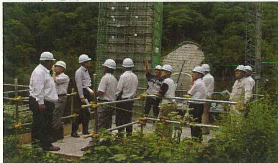
(県トラック協会県南支部の方々)