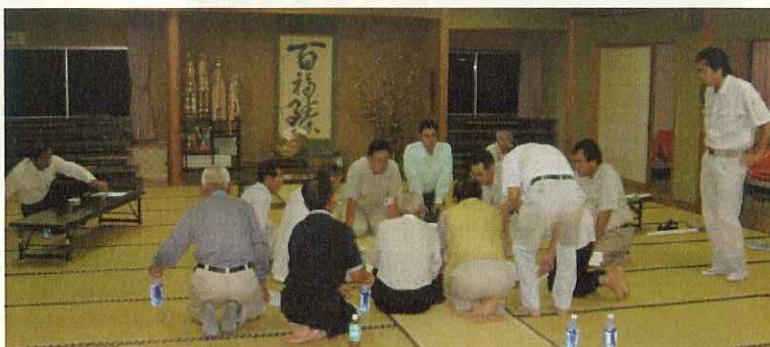
(地元説明会 開催状況)

岩井川バイパス～肴沢橋間の工事で、片側交互通行を行いますので、地域の皆様方にはご迷惑をおかけしますが、ご協力宜しくお願いします。