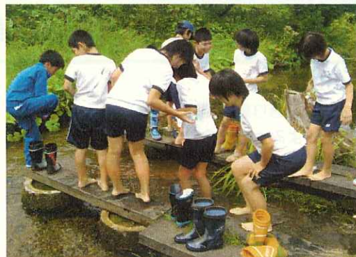
(大柳沼上沼湧水にて)