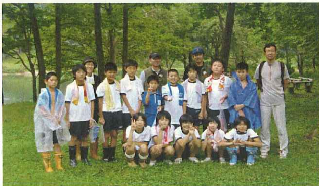
(大柳沼自然公園キャンプ場で記念撮影)