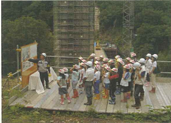
(1号橋下部工の説明を熱心に聞く)