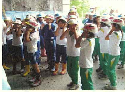
(1号トンネルの発破前状況)

午後からは、東成瀬村の自然豊かなフィールドを題材に、自然散策、成瀬川の水質調査、ゴムボート体験を実施しました。