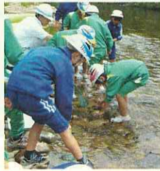
(どんな生物がいるのかな?)