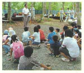
(おわかれのあいさつ)