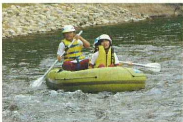
(ゴムボート体験 ドキドキです)