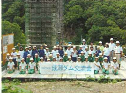
(1号橋下部工P2橋脚をバックに)

ダムサイトでの概要説明、学校紹介後、1号橋下部工工事及び1号トンネル工事を見学しました。子供達はみんな元気いっぱい、現場内を軽快に歩き回っていました。特に興味を持ったのがトンネル工事のダイナマイトの爆発音で、「ドーン」という音にみんなびっくり仰天でした。