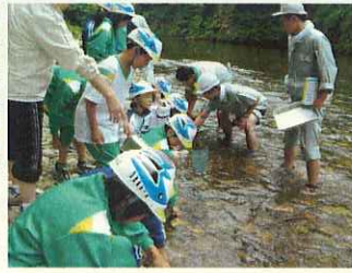
(成瀬川はきれいだな!)