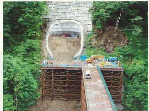
(仮栈橋からP1(奥), P2(手前)を望む) (P3竹割り型構造物掘削施工状況)

* 工事現場の案内も受け付けております。希望する方はお気軽に下記まで電話でお申し込み下さい。