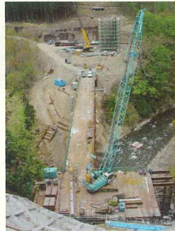
(P3法面上からの眺め)

* 工事現場の案内も受け付けております。希望する方はお気軽に下記まで電話でお申し込み下さい。