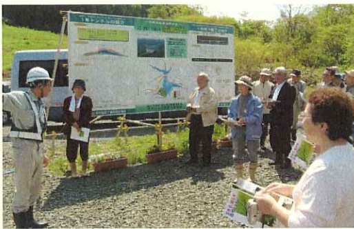
(田中監督官の概要説明)

平成19年5月30日、東成瀬村社会福祉協議会の行事の一環として、多和楽会及び要介護老人家族の会の方々30名による、成瀬ダム現場見学会が行われました。ダムサイトでの概要説明の後、1号橋下部工工事及び1号トンネル工事を見学しましたが、まだまだ皆さん元気いっぱい、現場内を隈無く歩き回っていました。中でもトンネル工事の掘削状況は初めて見る方がほとんどで、興味深く見学していました。