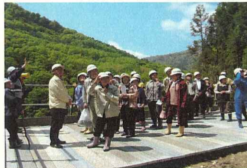
(1号橋下部工の見学状況)