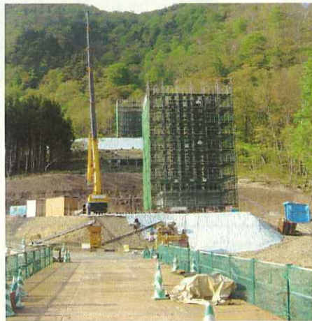
(仮栈橋からP1, P2を望む)