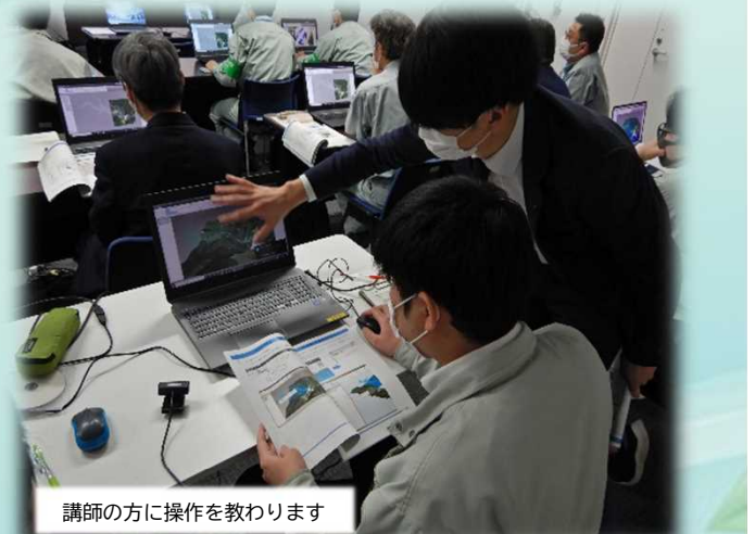
講師の方に操作を教わります

今回の講習会は今後色々な場面で活用できる内容であり、CIMの操作性を改めて確認する良い機会になりました。