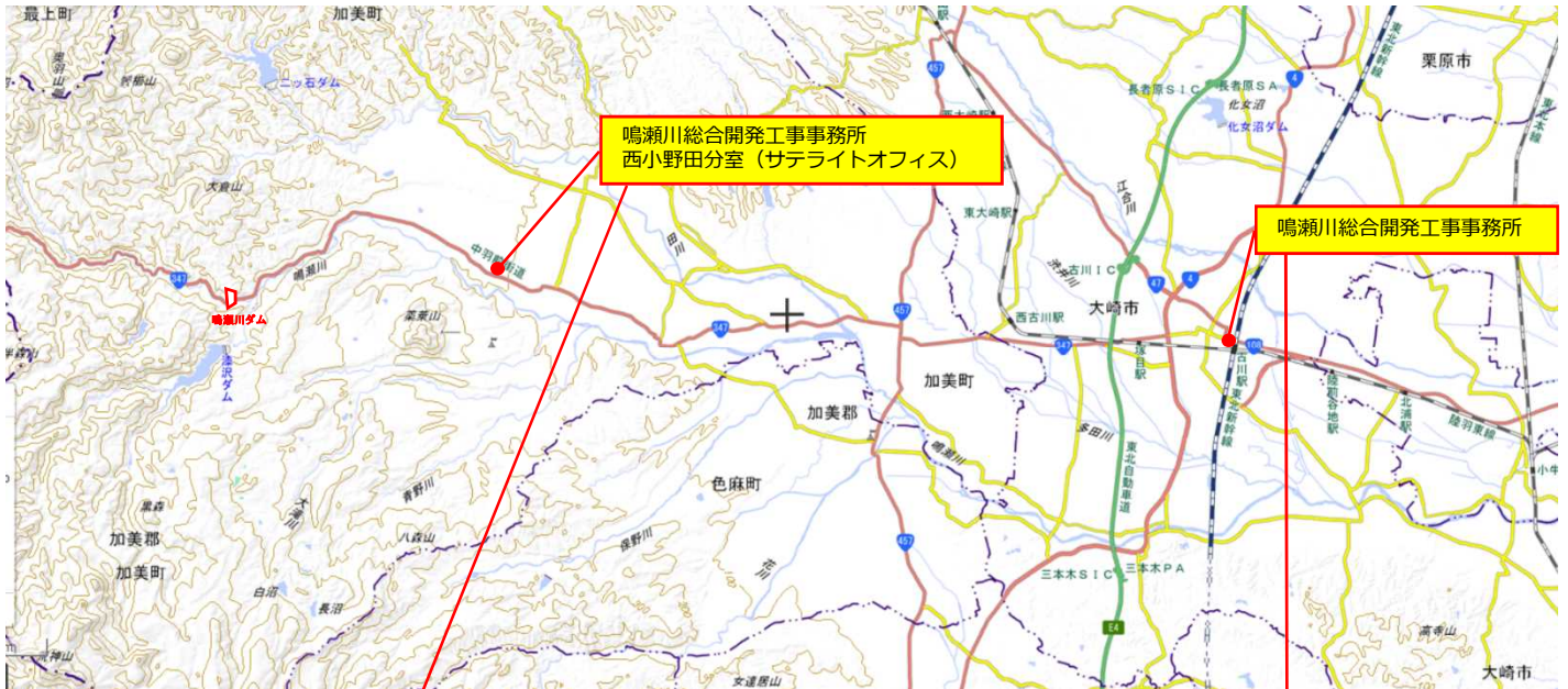
地理院地図に位置を追記