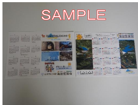
オリジナルカレンダーのサンプル

※2. たくさんの方に受け取っていただきたいため、カレンダーの配布は1人1枚とさせていただきますのでご協力をお願い致します。