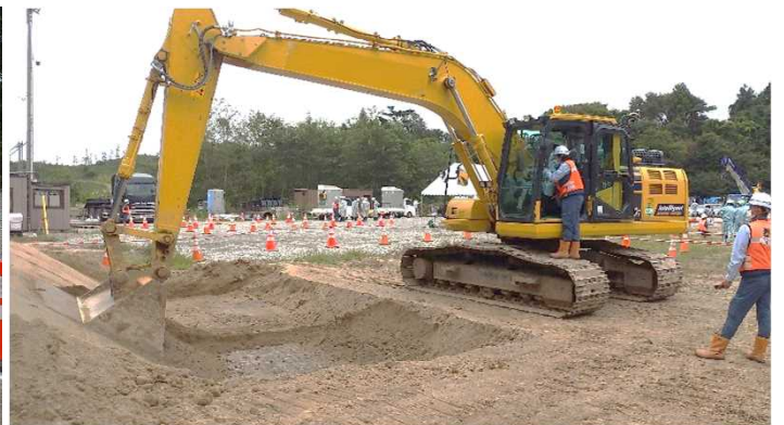
バックホウ操作体験