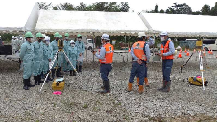
測量器具を使った測量体験