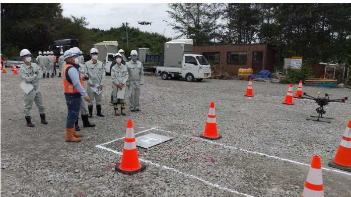
ドローン操作体験