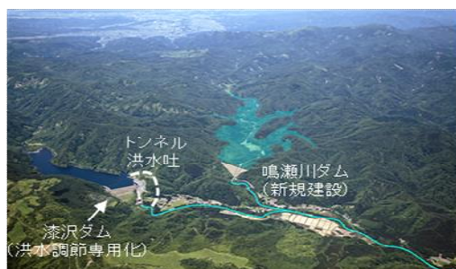
鳴瀬川総合開発事業完成イメージ図