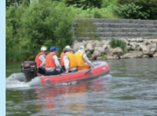
船による河岸の情報収集等