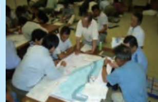
マイ防災マップづくり