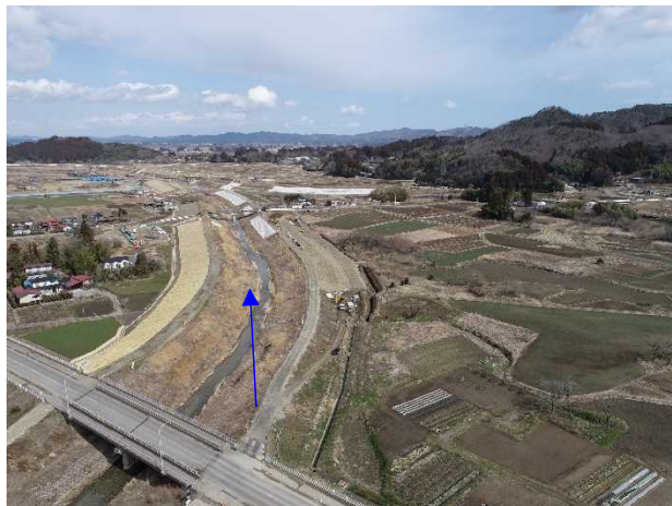
⑳阿武隈川水系内川流域築堤外(その12)工事 五福谷川 河川土工 施工中 〈五福谷川橋下流〉