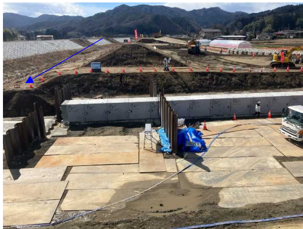
⑧内川流域災害復旧施設外(その3)工事 樋管⑧ 樋管本体内工 施工中 〈内川橋上流〉