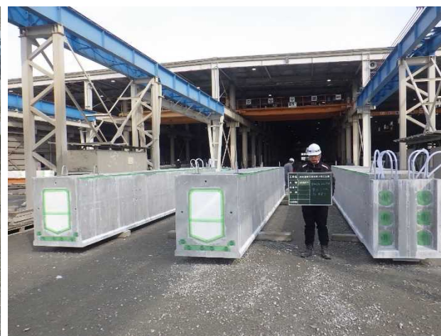
⑤内川流域五福谷橋上部工工事 旧五福谷橋 主桁製作完了(2本/全5本中)