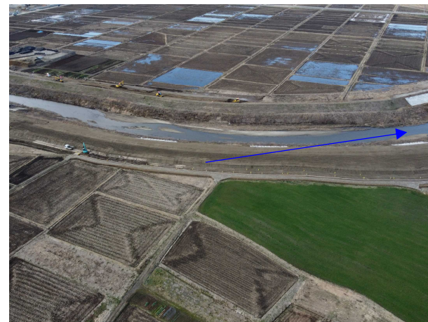
⑮阿武隈川水系内川流域築堤外(その7)工事 内川 河川土工 施工中 〈内川橋下流〉