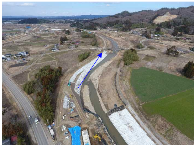
⑱阿武隈川水系内川流域築堤外(その11)工事 内川 河川土工 施工中 〈和田橋下流〉