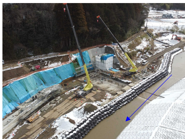
⑩内川流域堰ゲート設備災害復旧工事 埋設据付完了(山下堰) 〈大目橋下流〉