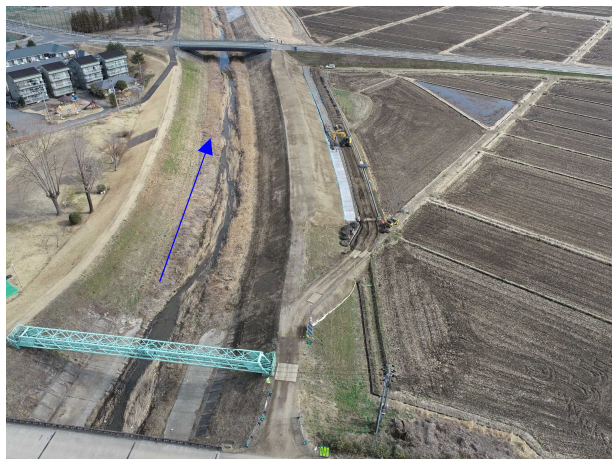
⑬阿武隈川水系内川流域築堤外(その5)工事 新川 河川土工 施工中 〈泉橋下流〉