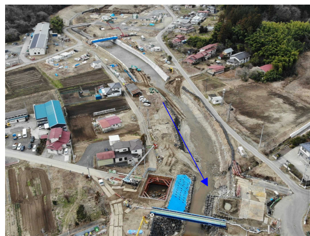
⑰阿武隈川水系内川流域築堤外(その9)工事 五福谷川 ブロック積 施工中 〈旧五福谷橋上流〉