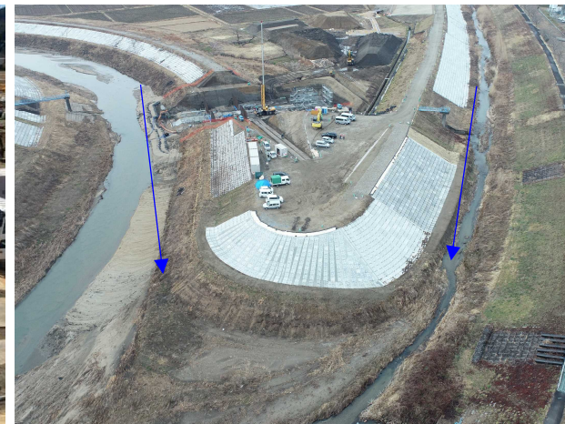
⑨内川流域災害復旧施設外(その4)工事 樋管③ 樋管本体内工 施工中 〈内川・新川合流点〉