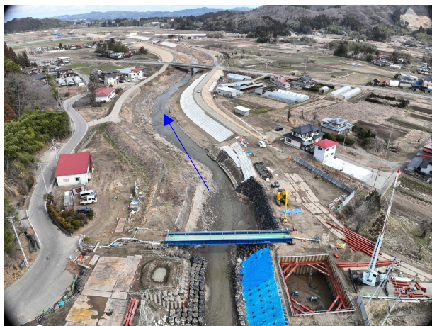
①阿武隈川水系内川流域築堤外工事 五福谷川 河川土工 施工中 〈上地橋上流〉