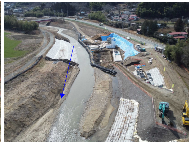
③内川流域和田堰（左岸）工事 和田堰(左岸) 堰本体工 施工中 〈和田橋下流〉