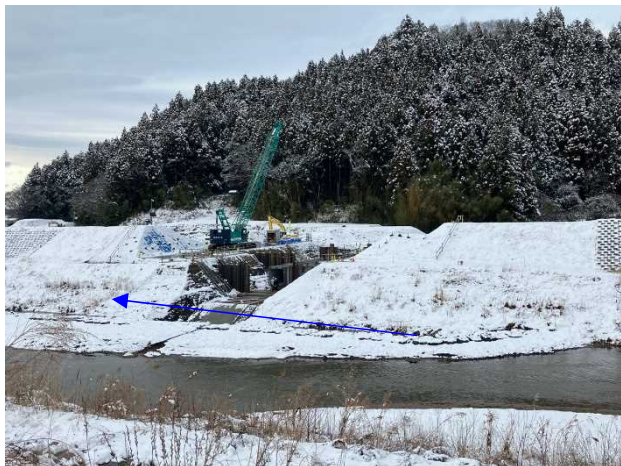
⑦内川流域災害復旧施設外(その2)工事 樋管④ 樋管本体内工 施工中 〈内川橋下流〉