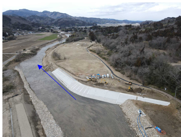
⑪阿武隈川水系内川流域築堤外(その3)工事 内川 法覆護岸工・導水路工 施工中 〈矢田橋上流〉