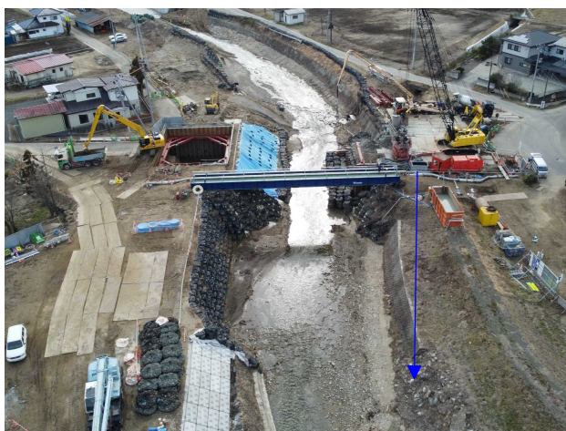
④内川流域橋梁下部工工事 旧五福谷橋 旧橋撤去工 施工中 〈旧五福谷橋上流〉