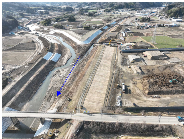
⑭阿武隈川水系内川流域築堤外(その6)工事 内川 河川土工 施工中 〈内川橋上流〉