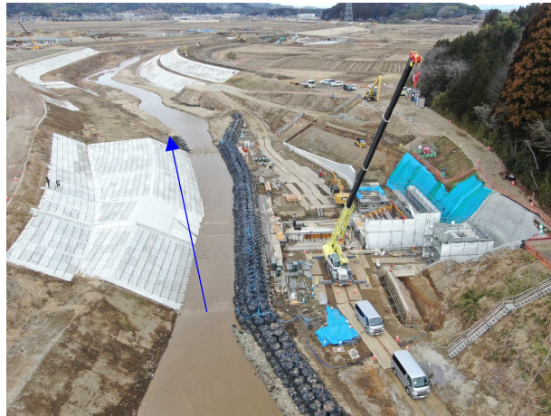
②内川流域山下堰（右岸）工事 山下堰(右岸) 堰本体工 施工中 〈大目橋下流〉