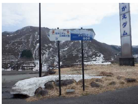
補修後(案内看板の位置を補修)