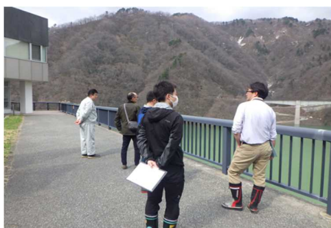
長井ダムの点検実施状況 (ダム周辺)