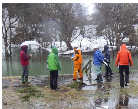
白川ダムの点検実施状況 (湖岸公園)