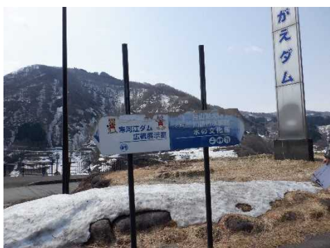
補修前(案内看板の不具合)