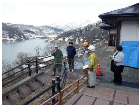
寒河江ダムの点検実施状況 (ダム周辺)