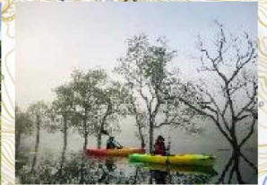
①④⑤⑥ アクテビティ提供