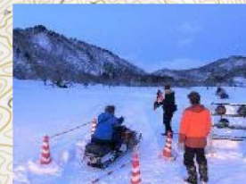
① スノーモービル体験