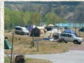
② オートキャンプ場