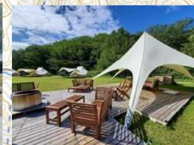
④ グランピング施設