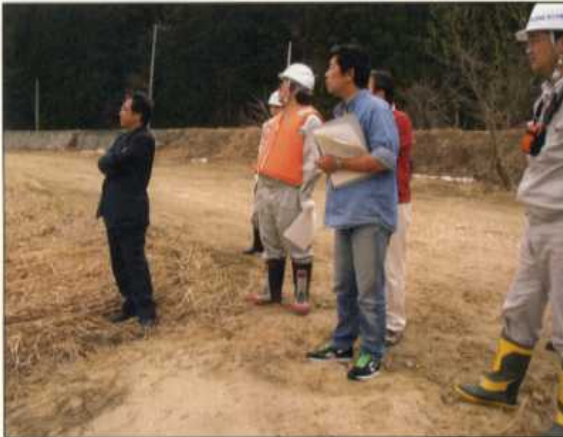
○朝日町及び山形カヌークラブと合同点検