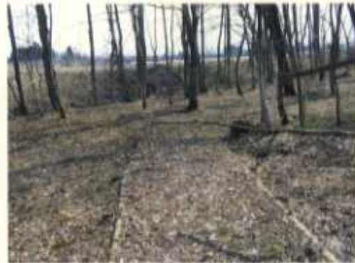
フットパス(散策路)に倒木