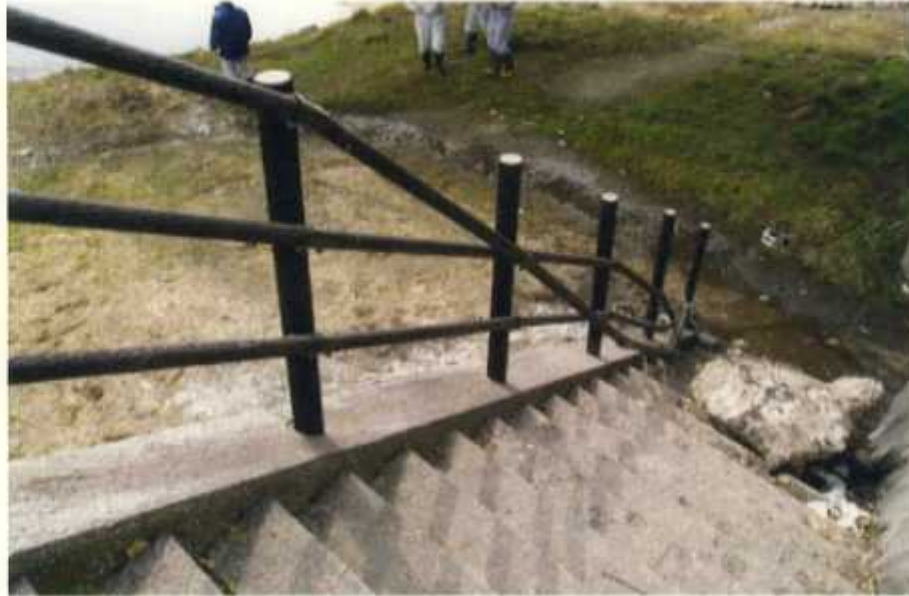
○大石田特殊堤の堤外側階段手摺りが破損している。