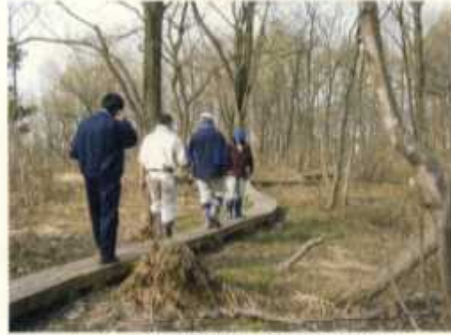
フットパス(散策路)の点検状況