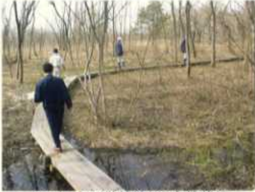
フットパス(散策路)の点検状況