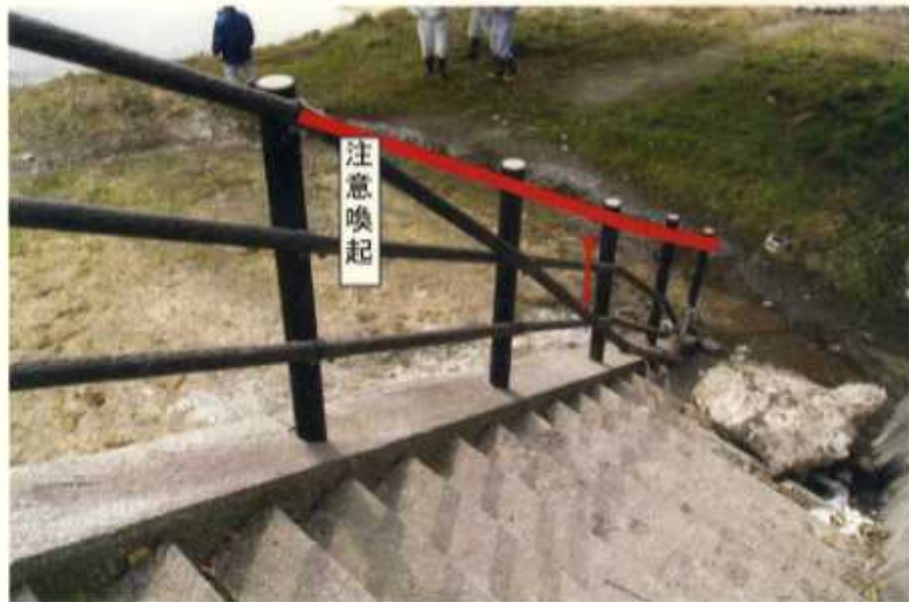
○脱落した手摺を仮設置し、注意喚起の表示をする。 4月28日まで実施し、夏休み前までに本補修する。