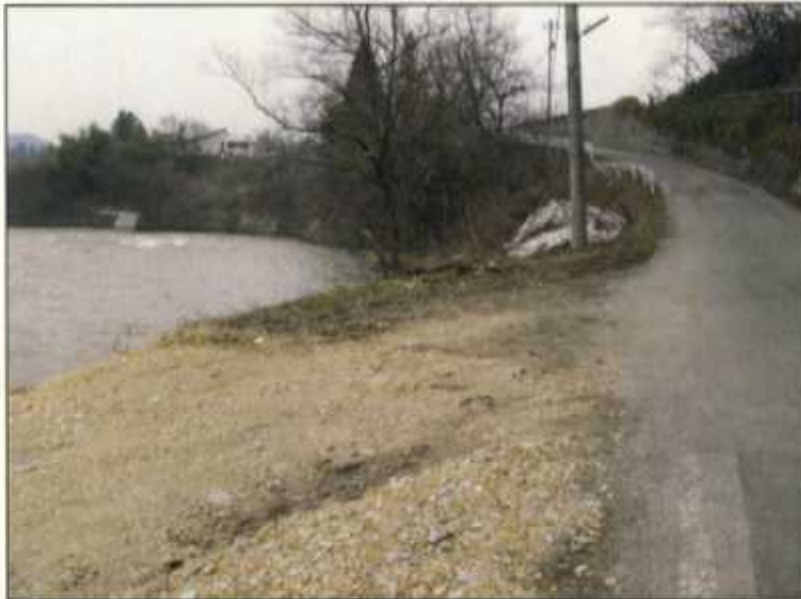
○転落防止柵の延長不足