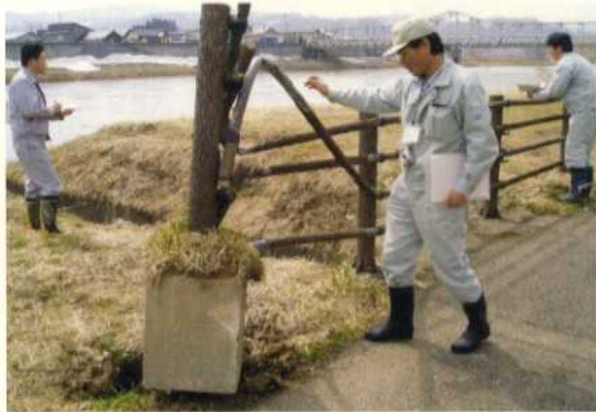
○大石田船着場親水公園の散策路手摺りが破損している。