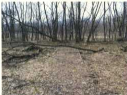
フットパス(散策路)に倒木