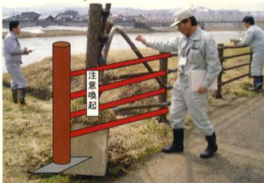
○支柱部分を埋め戻し、破損した手摺を撤去し単管を仮設置する。 4月28日まで実施し、夏休み前までに本補修する。