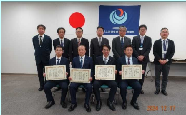
▲ 被贈呈者との集合写真

令和6年12月17日(火)、南三陸沿岸国道事務所にて、令和6年8月豪雨で発生した「釜石自動車道41.5kp上り(遠野市綾織地内)の法面崩落災害」において、迅速な応急復旧等へご尽力いただいた団体に対し、事務所長から御礼状を贈呈しました。昼夜を問わず作業に従事していただき、早期の交通開放に貢献いただきました。この場を借りて、改めて御礼申し上げます。