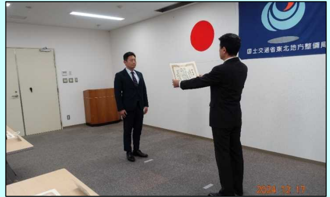
▲ 武田事務所長による御礼状の贈呈

※手前左から(株)テラ、日特建設(株)東北支店、日本工営(株)北東北事務所、新日本工営(株)