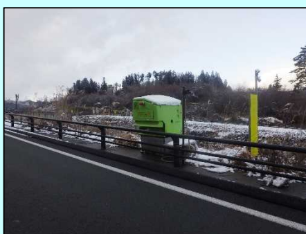
凍結抑制剤散布装置