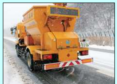
凍結抑制剤散布車