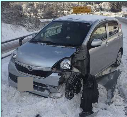
スリップ事故(遠野市宮守町)

規制速度を守って、車間距離を十分に取り、いつでも不測の事態に対処できるようにしましょう。