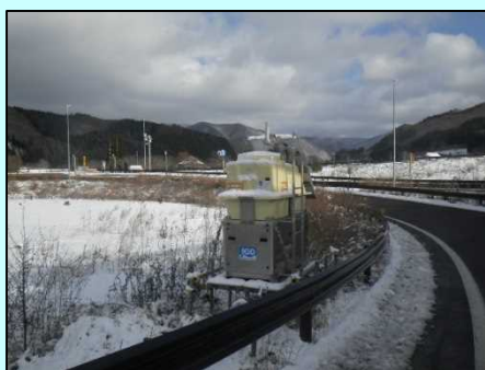
凍結抑制溶液自動散布装置