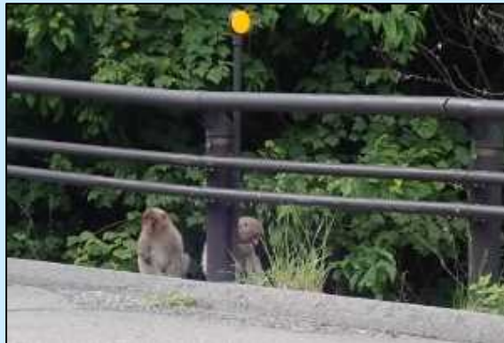
道路脇に猿を発見 (令和3年6月8日釜石市甲子町)