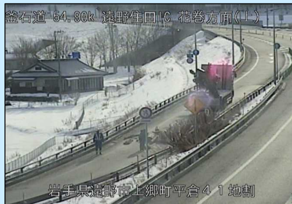
トラックの積荷が落下 (令和4年2月17日遠野市上郷町)