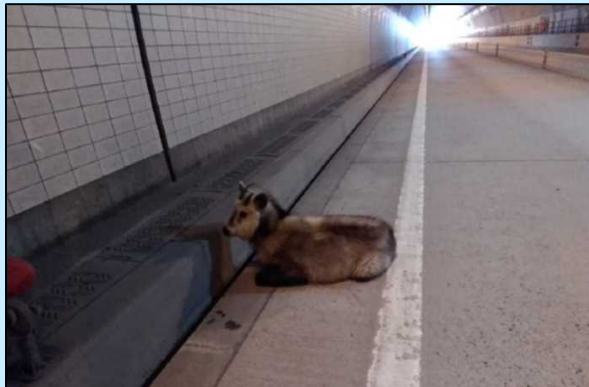
カモシカがトンネル内に侵入 (令和3年4月8日新仙人トンネル内)