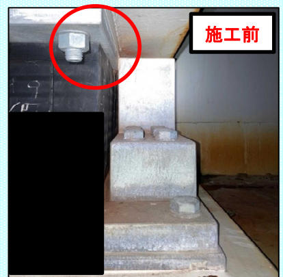
水平方向に変位したことで部材が接触し不具合が発生

ししょう 「支承」とは、橋梁の上部構造と下部構造を支え、上部からの力を下部構造へ伝達する役割を担う部材です。地震の影響で「支承」が水平方向に変位したことで、本来の機能を発揮出来ない状態となっていたことから、それを解消するための橋梁補修工事を行いました。