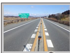
視覚的な認識 ドットライン