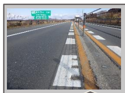
体感的な警告 ランブルストリップス