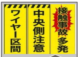
注意喚起 注意喚起看板

E45三陸沿岸道路において、事故が発生してしまうと、事故処理や安全施設の復旧作業で、インター間での通行止めが必要になる場合もあり、交通への影響も発生いたします。通行する際は、引き続き安全運転をお願いいたします。