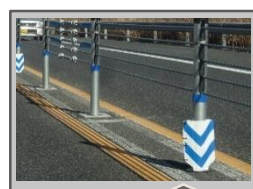
視覚的な注意 高輝度反射シート