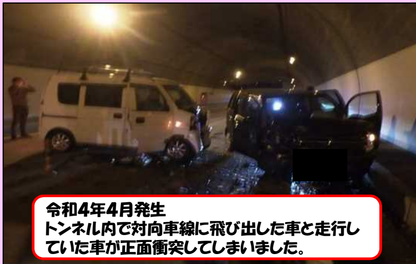
令和4年4月発生 トンネル内で対向車線に飛び出した車と走行していた車が正面衝突してしまいました。