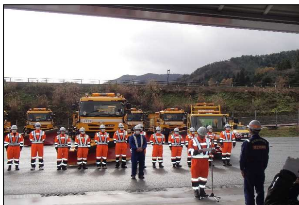
オペレーターによる安全宣言