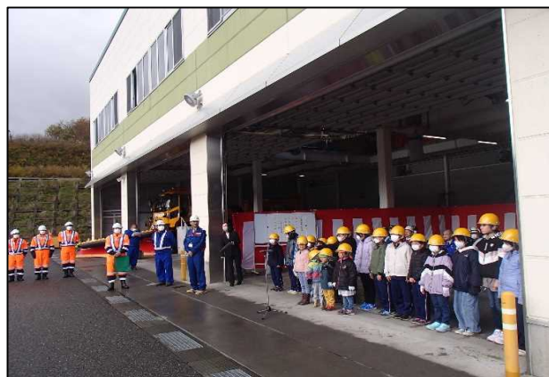
小学校児童による出発の号令