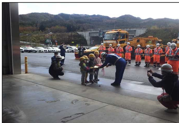
小学校児童によるキー引渡し