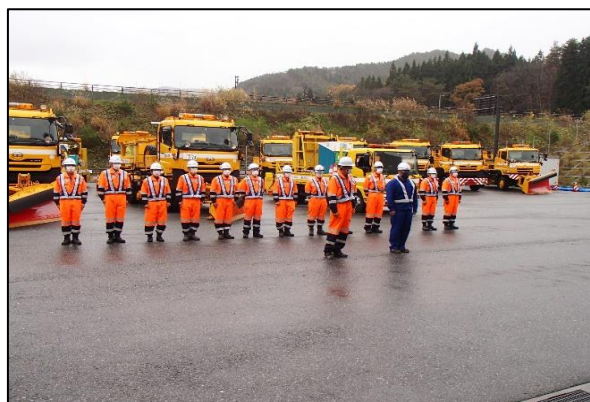
オペレーターによる安全宣言