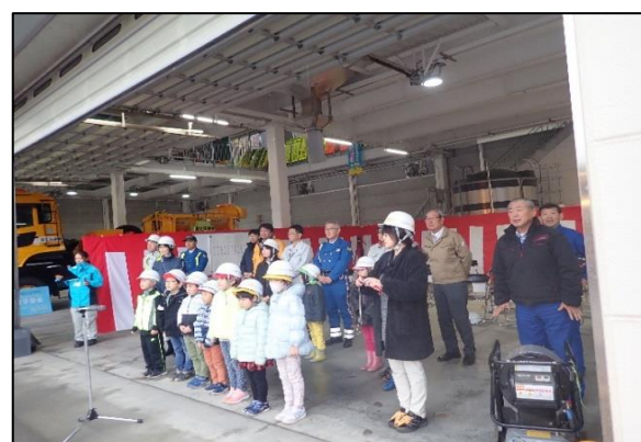
小学生による出発の号令