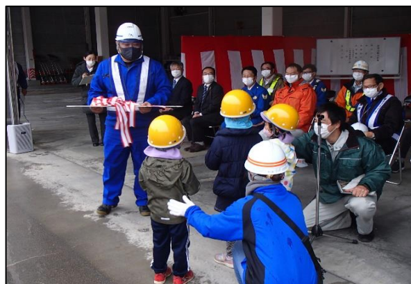
保育園児によるキー引渡し