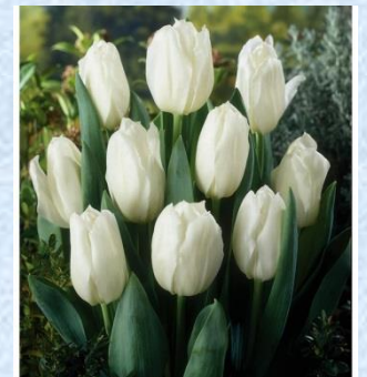
ホホワイトマーベル