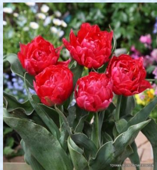
フラッシュポイント