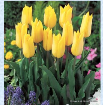
ストロングゴールド