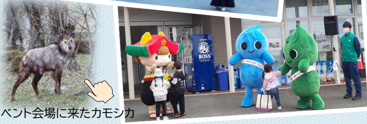
昨年イベント会場に来たカモシカ

主催 四十四田ダムさくらまつり実行委員会 共催 盛岡市・滝沢市・八幡平市・岩手町・岩手県企業局 北上川ダム統管理事務所