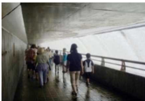
錦秋湖大滝裏側一般開放の状況