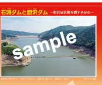
表面は石淵ダムと胆沢ダムの同時空撮写真