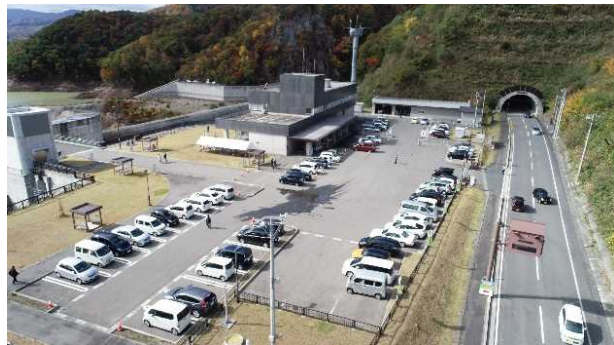
来訪者状況の様子