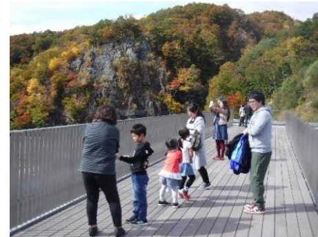
屋上展望台の様子