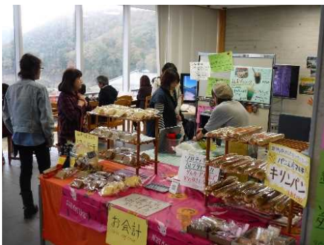
岩ダムカフェの様子