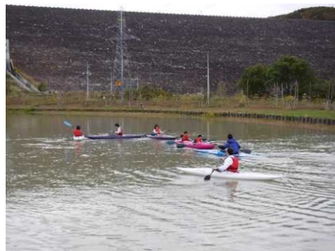
カヌー体験会、紅葉カヌーツアーの様子