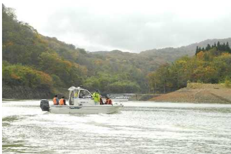
湖面巡視体験会の様子