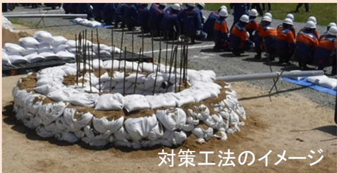
対策工法のイメージ