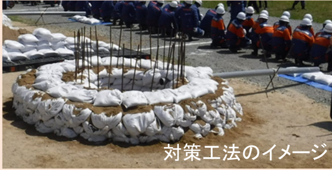
対策工法のイメージ