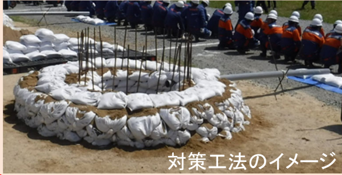
対策工法のイメージ