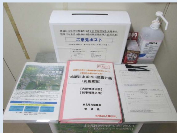
宮城県土木部河川課 意見箱設置状況