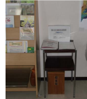
北上川下流河川事務所(閲覧室)