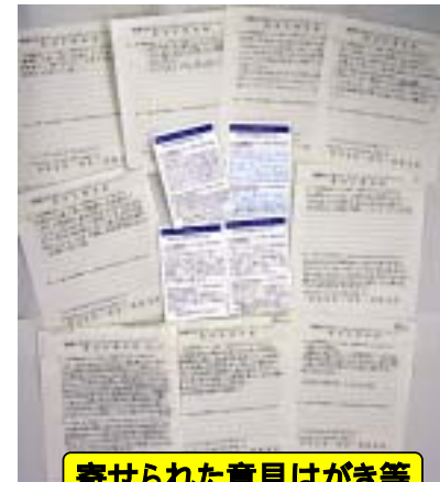
寄せられた意見はがき等