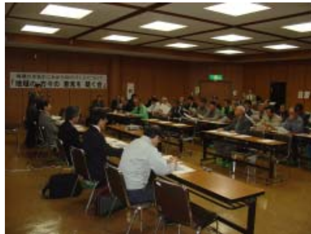
東松島市小野公民館