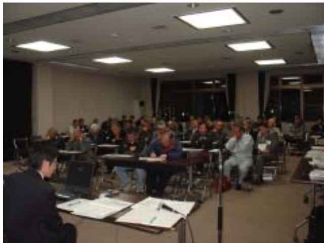
大和町吉岡コミュニティ・センター