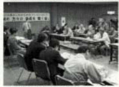
鳴瀬川河口の砂堆積問題などについて、東北地方整備局に意見を述べる住民。東北地方整備局の小野公展副局長が説明している。