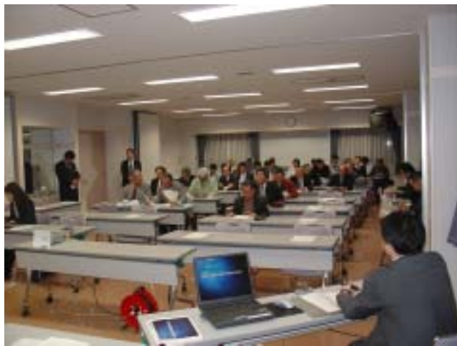
大崎市鎌田記念ホール