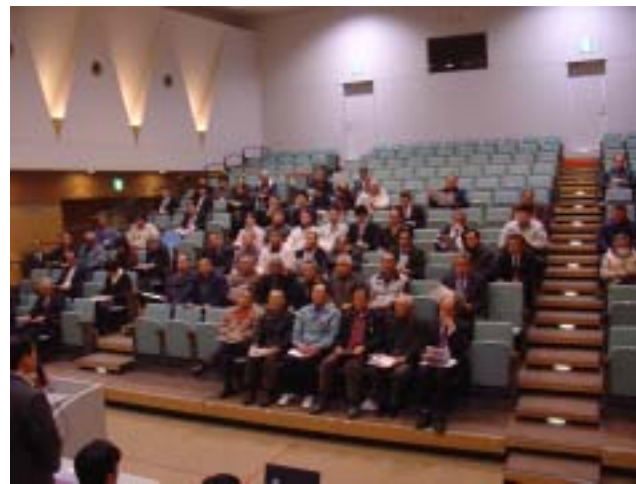
大崎市三本木総合支所 ふれあいホール