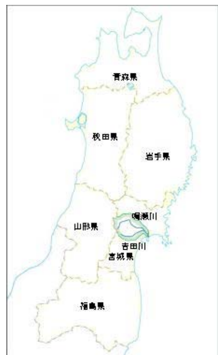
(参考図) 鳴瀬川水系図