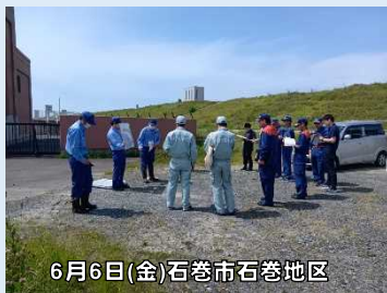
6月6日(金)石巻市石巻地区

出水期を前に、地元の水防団、自治体等と河川管理者が合同で出水時に危険が予想される箇所(重要水防箇所)を巡視しました。迅速な水防活動を行うために必要な情報を共有し、現地で意見交換を行いました。