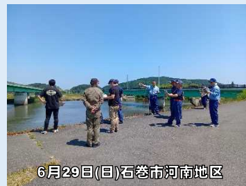
6月29日(日)石巻市河南地区