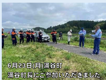
6月23日(月)涌谷町 涌谷町長にご参加いただきました