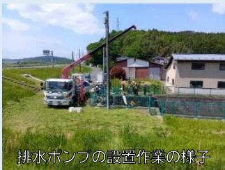
排水ポンプの設置作業の様子