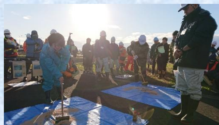
油吸着材をブラシで混ぜ、油と吸着材をなじませて回収する方法の演習風景