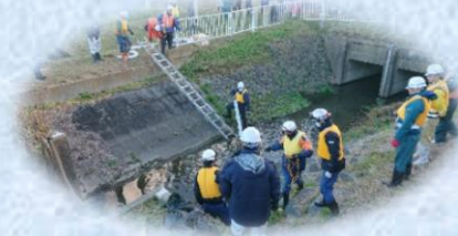
講師(NPO自然エネルギー・環境協会)