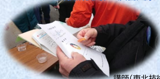
講師(東北技術事務所)