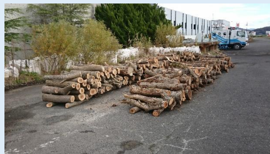
伐採木仮置き状況