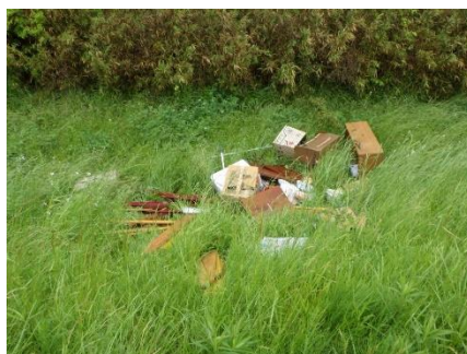
▲タンスや段ボールなど多数の投棄