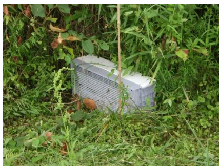
▲エアコンの室外機