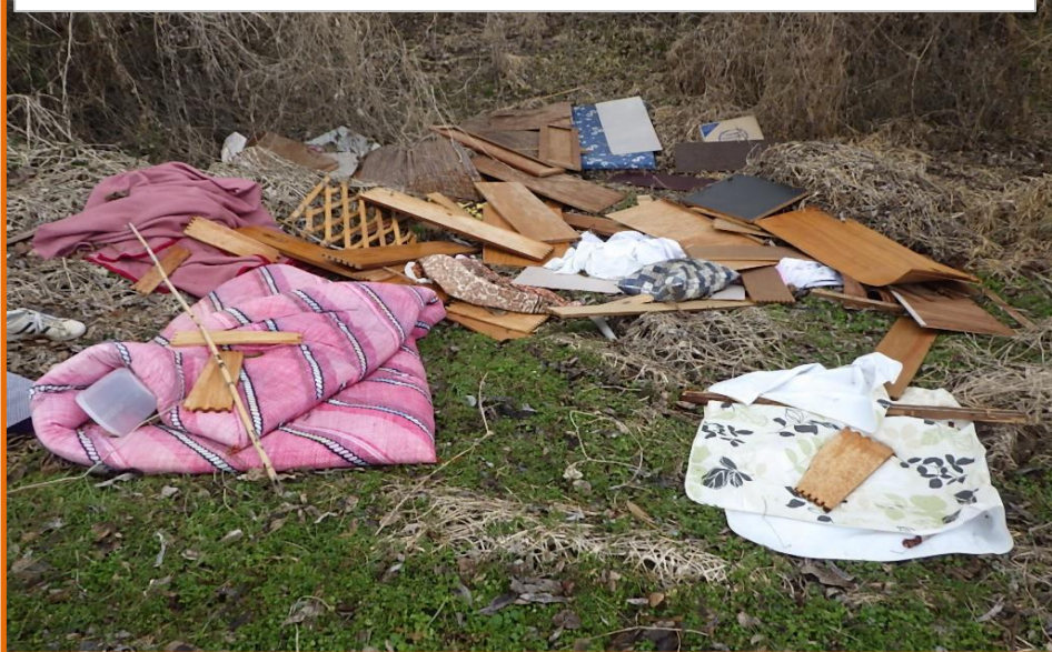
引っ越しに合わせて投棄されたと思われるゴミ