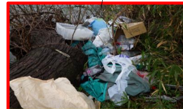
カラーボックス・段ボール