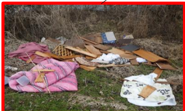
毛布・ベッドの木枠