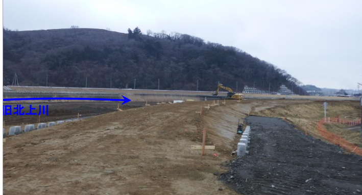
旧北上川石巻右岸下流地区築堤工事(袋谷地地区)