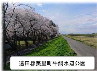
遠田郡美里町牛飼水辺公園

点検箇所の「桜つつみ公園」、「牛飼水辺公園」の桜が綺麗に咲いていました。来年、お近くへお越しの際はぜひご覧ください！