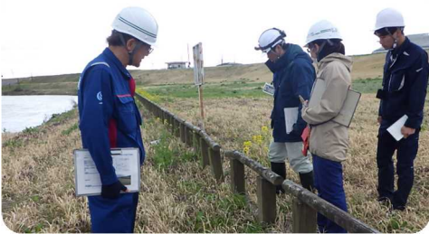
公園を管理されている大崎市、美里町の職員の皆様と出張所職員が合同で点検を実施(写真は下伊場野地区水辺の楽校)

ゴールデンウィークを迎えるにあたり、多くの方々が水辺を利用することが見込まれます。