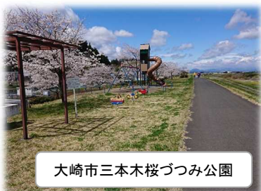
大崎市三本木桜つつみ公園