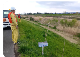
本番ながらに現地に出向き、通信機器等を用いた訓練を行いました。