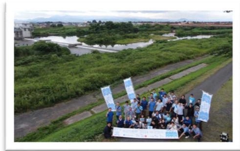
7月7日午後7時7分に北上川下流河川事務所管内の「大崎かわまちづくり協議会(吉田川)」、「石巻ミズベリング(旧北上川)」と中継を結び実施しました。

ウェブサイト https://www.mlit.go.jp/river/kankyo/main/kankyou/machizukuri/index.html