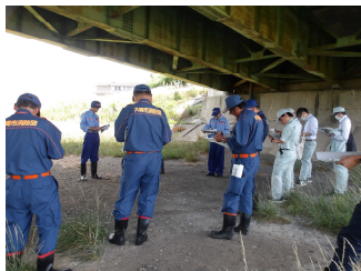
巡視終了後、現地で意見交換の様子。