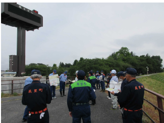
現地での重要水防箇所の説明の様子。

大崎出張所管内では、6月17日に大崎市古川地区、6月18日に美里町小牛田地区、6月26日に三本木地区、田尻地区を巡視しました。