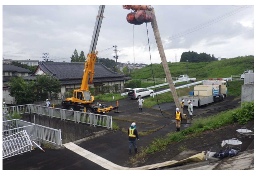
三本木排水ピット