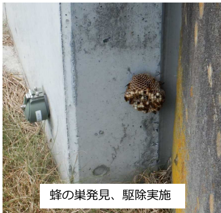
蜂の巣発見、駆除実施