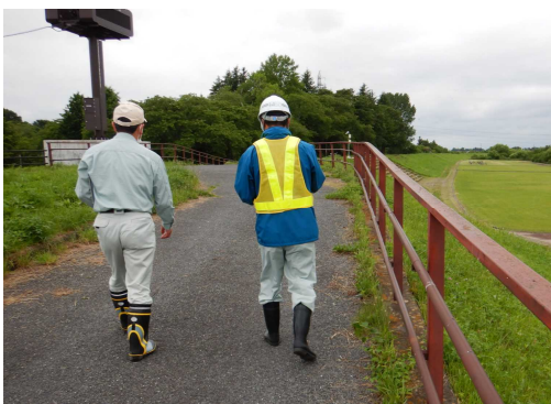
牛飼水辺公園点検