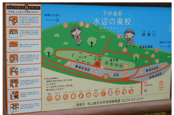
下伊場野水辺の楽校 案内図