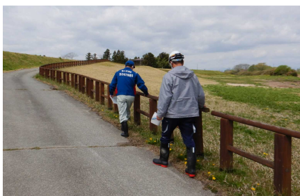
下伊場野地区水辺の楽校