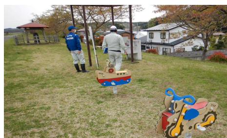
三本木桜づつみ公園