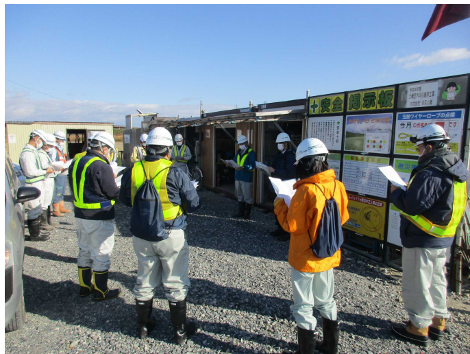
全体説明 大崎管内河川維持工事現場事務所