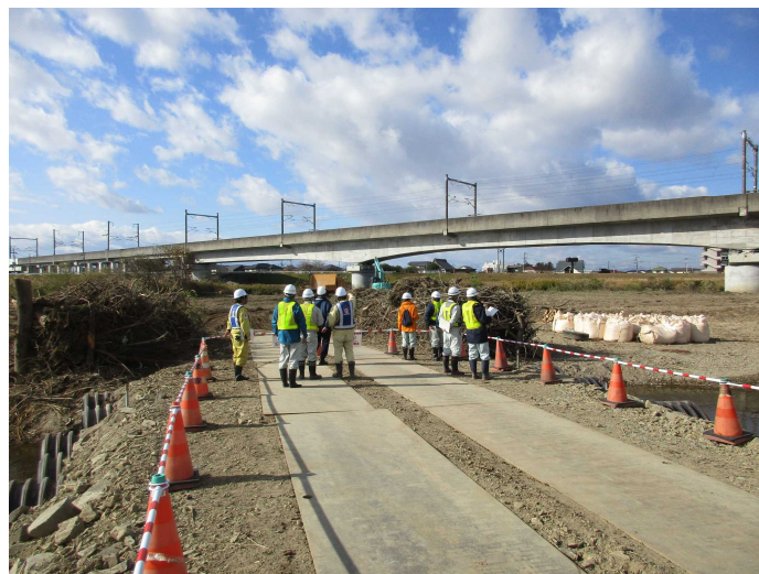
江合川 中州伐採工事現場