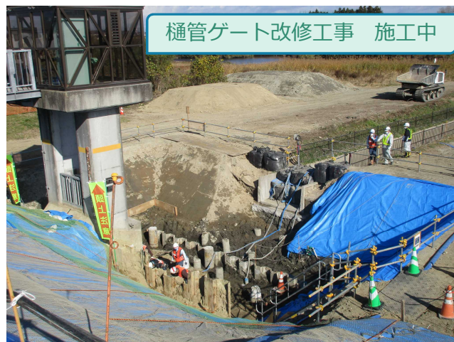
樋管ゲート改修工事 施工中