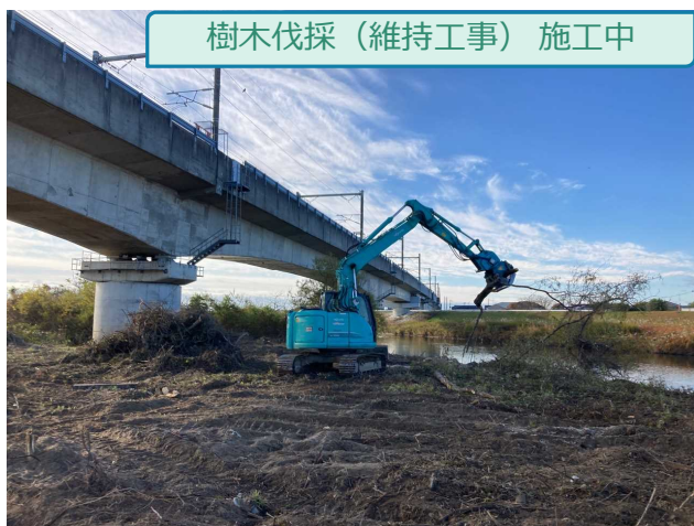
樹木伐採（維持工事） 施工中