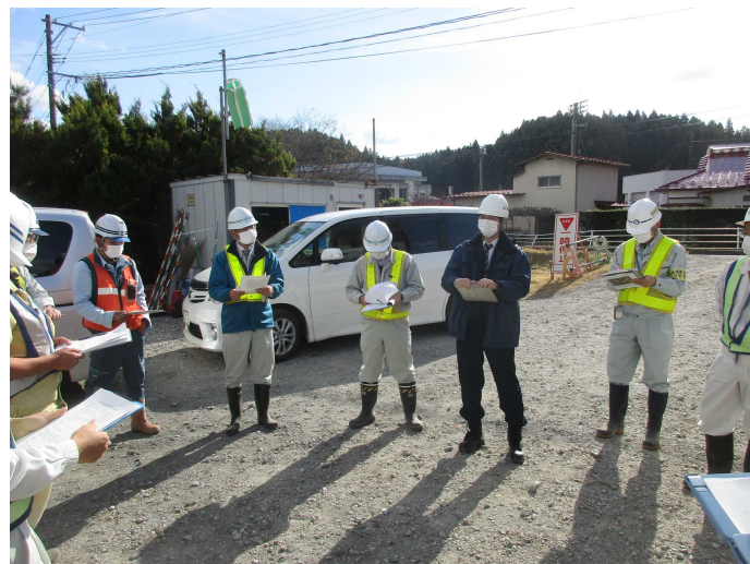
講評 古川労働基準監督署