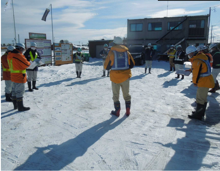
現場内点検の様子

安全管理体制、保安設備状況等についてのチェックシートをもとに現場をパトロールし、終了後には良い点、悪い点等の意見交換会を行いました。安全な工事現場となるように、意見交換で指摘があった箇所については改善対策を行いながら、引き続き無事故での工事完成に向けて取り組んでいきます。